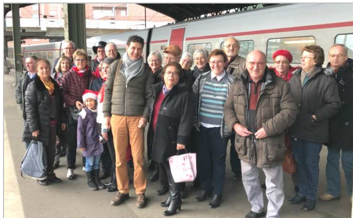
Le groupe au départ de la gare SNCF de Bâle.

Le groupe s'est restauré dans une brasserie bâloise, puis l'après midi fut consacré à la visite du féerique marché de Noël de Bâle. Le retour se fit en tram jusqu'à la gare SNCF de Bâle, puis en TER 200 jusque Mulhouse et en TER type AGC de Mulhouse à Bollwiller.