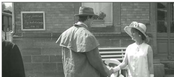
Ci-dessus Jeanne Moreau à la gare de Lautenbach lors du tournage en 1961 de "Jules et Jim".

En collaboration avec FloriRail, des expositions et présentations auront lieu durant cette période. Le programme vous parviendra bientôt. Tous les membres de FloriRail y sont cordialement invités.