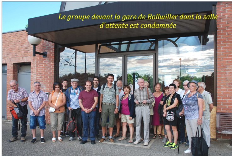
Le groupe devant la gare de Bollwiller dont la salle d'attente est condamnée

Vingt-cinq personnes ont participé à cette excursion. Le départ fut donné dimanche matin 30 août à 8h10 en gare de Guebwiller pour se rendre en covoiturage à la gare de Bollwiller. De là nous avons emprunté l'AGC (autorail à grande capacité) pour Mulhouse de 8h43, puis à Mulhouse celui en correspondance pour Bâle. Après avoir traversé la ville en tram pour rejoindre la gare badoise de Bâle, nous avons emprunté un train régional pendulaire allemand de marque Fiat VT610 jusqu'à Erzingen. Nous sommes alors montés dans un train omnibus "GTW" de marque Stadler pour rejoindre Neuhausen. Ce train à plancher surbaissé, spacieux et confortable, a la particularité de disposer de larges vitres panoramiques permettant d'admirer la belle vallée du Rhin en Suisse.