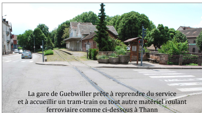
La gare de Guebwiller prête à reprendre du service et à accueillir un tram-train ou tout autre matériel roulant ferroviaire comme ci-dessous à Thann

FloriRail interpellera les candidats aux élections régionales à ce sujet en leur demandant quel est leur investissement en faveur de la finalisation de ce projet.