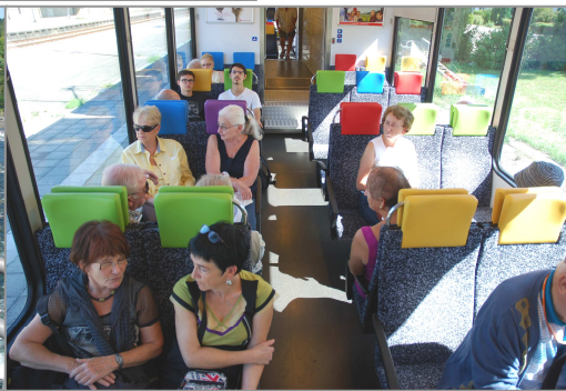
Cinq places de front dans les rames GTW !

méritent vraiment la visite. Ce sont les chutes les plus puissantes d'Europe. Le Rhin atteint à cet endroit une largeur de 150 m.