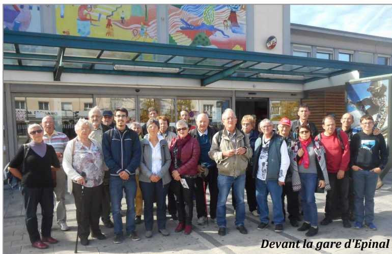
Devant la gare d'Epinal

FloriRail et l'association pour la promotion du chemin de fer Colmar - Metzeral (APCM) furent réunis pour entreprendre le tour des Vosges en train, samedi 3 octobre. Ce trajet un peu exceptionnel, nous a conduit tranquillement à travers 3 régions et 5 départements.