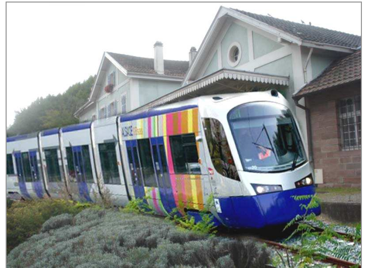
Montage photo d'un tram-train en gare de Guebwiller.

Selon les sources, une à deux rames de type Avanto de Siemens, sur les douze affectées à la ligne Mulhouse - Thann, sont disponibles suite à la réorganisation des circulations de train en décembre dernier sur cette ligne. Cette opportunité est à saisir car la Région n'aura pas à faire la dépense de l'achat d'un nouveau matériel roulant.