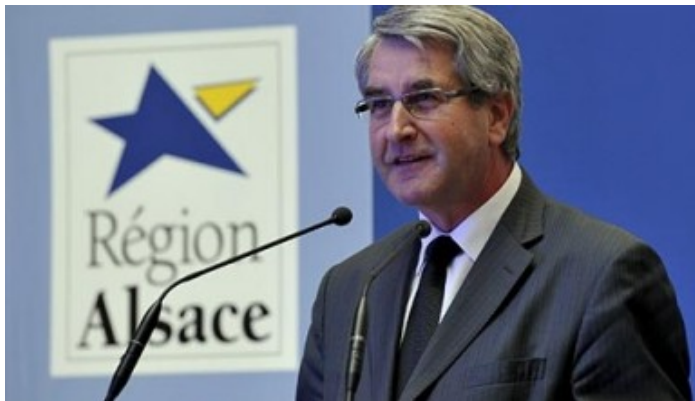
Philippe Richert, Président du Conseil Régional d'Alsace

Lors de la présentation du Schéma de Développement économique et d'innovation le 18 décembre, le Président de Région Philippe Richert a par ailleurs annoncé que le projet de "revitalisation" de la ligne ferroviaire Bollwiller – Soultz - Guebwiller sera intégré au contrat de plan Etat-Région. Manuel Valls le lui a assuré par écrit.