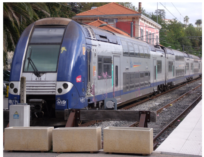
Ci-dessus, l'arrivée d'une automotrice Z26500 à Grasse en octobre 2012. Ligne visitée à plusieurs reprises par FloriRail.

Le Préfet de Région avait déclaré en novembre, devant le Conseil Régional d'Alsace que "le ministère ne rouvre pas une ligne fermée". Ces propos nous ont surpris, nous avons donc dressé avec l'aide de la Fédération Nationale des Associations d'Usagers des Transports (FNAUT), la liste des réouvertures (ou revitalisations) de lignes en France.