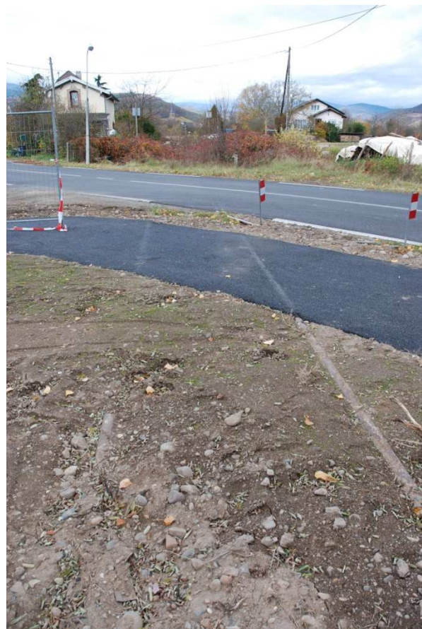
A l'entrée de Soultz, sur la route de Raedersheim, les rails ont été recouverts de goudron (octobre 2010)

Extensions du réseau tram-train projetées en 1998. Guebwiller était en bonne place pour être N°2. Depuis, beaucoup d'eau a coulé sous les ponts de la Lauch, et de bitume sur la ligne du Florival (photo ci-dessous)