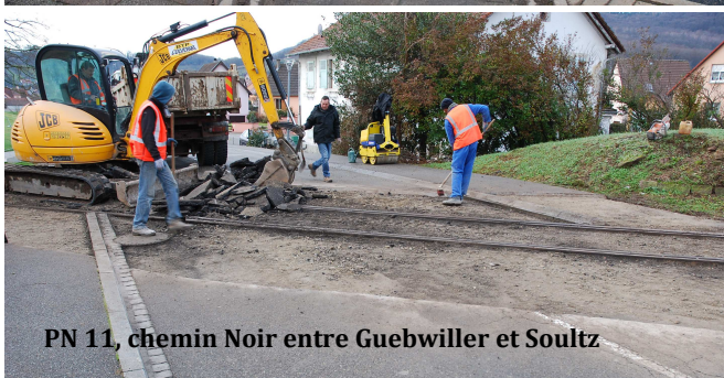
PN 11, chemin Noir entre Guebwiller et Sultz