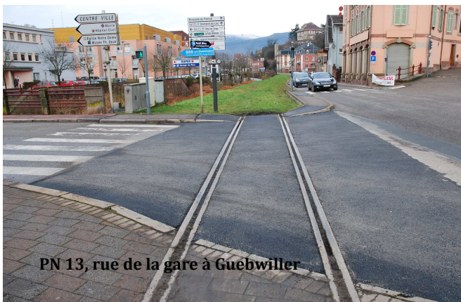
PN 13, rue de la gare à Guebwiller

Depuis quelques jours, à notre grand étonnement, nous avons remarqué la présence de panneaux signalant des travaux aux PN 13 (gare de Guebwiller) et du PN 11 (Chemin Noir). Nous avons eu le plaisir de constater les 18 et 19 décembre que RFF (Réseau Ferré de France) a mandaté une entreprise pour refaire les enrobés à ces PN. Les passages à niveau des véhicules se feront plus en douceur. Ce tout début de travaux de réfections est très encourageant et confirme la volonté de réouvrir la ligne.